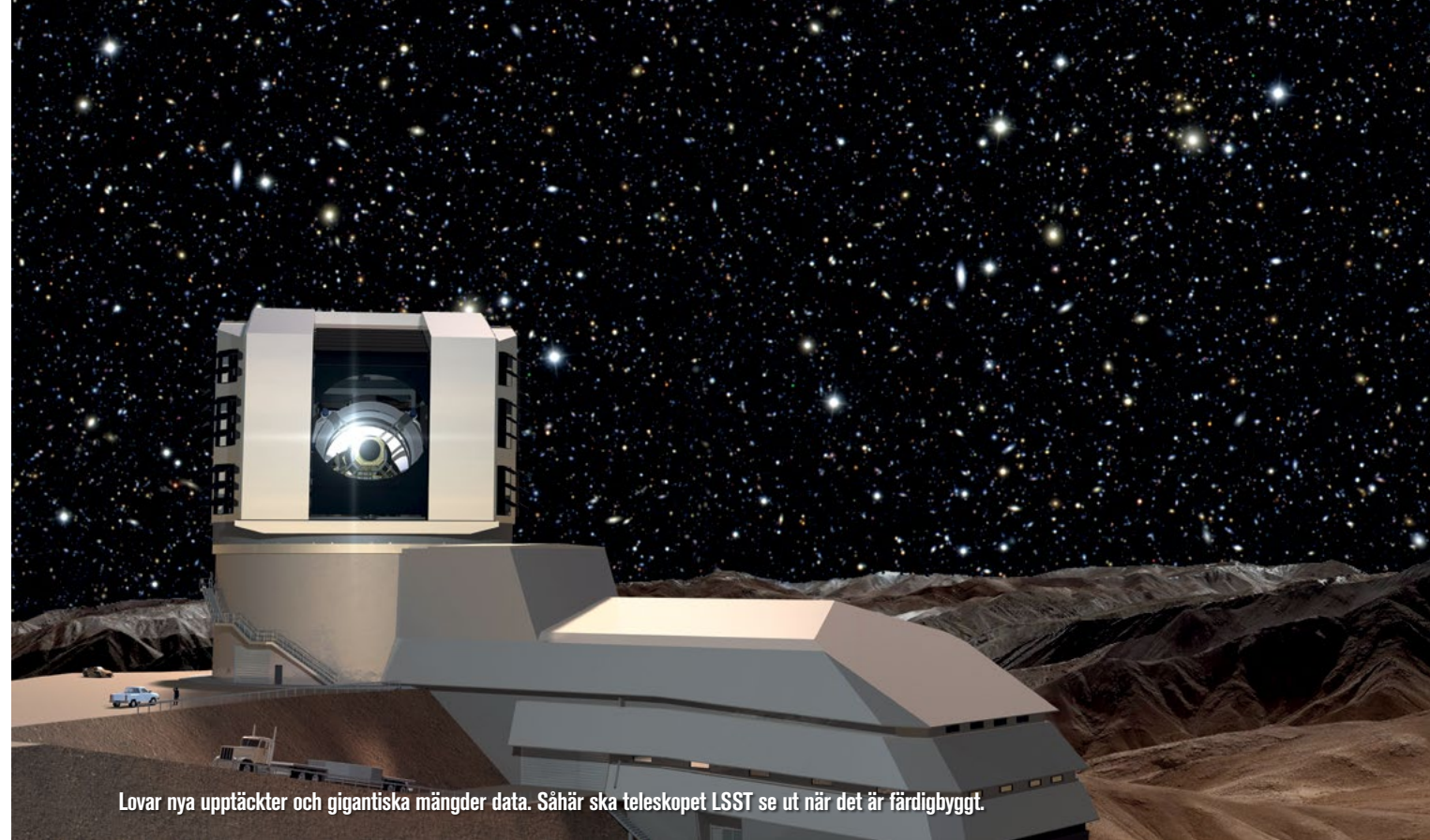
Lovar nya upptäckter och gigantiska mängder data. Såhär ska teleskopet LSST se ut när det är färdigbyggt.