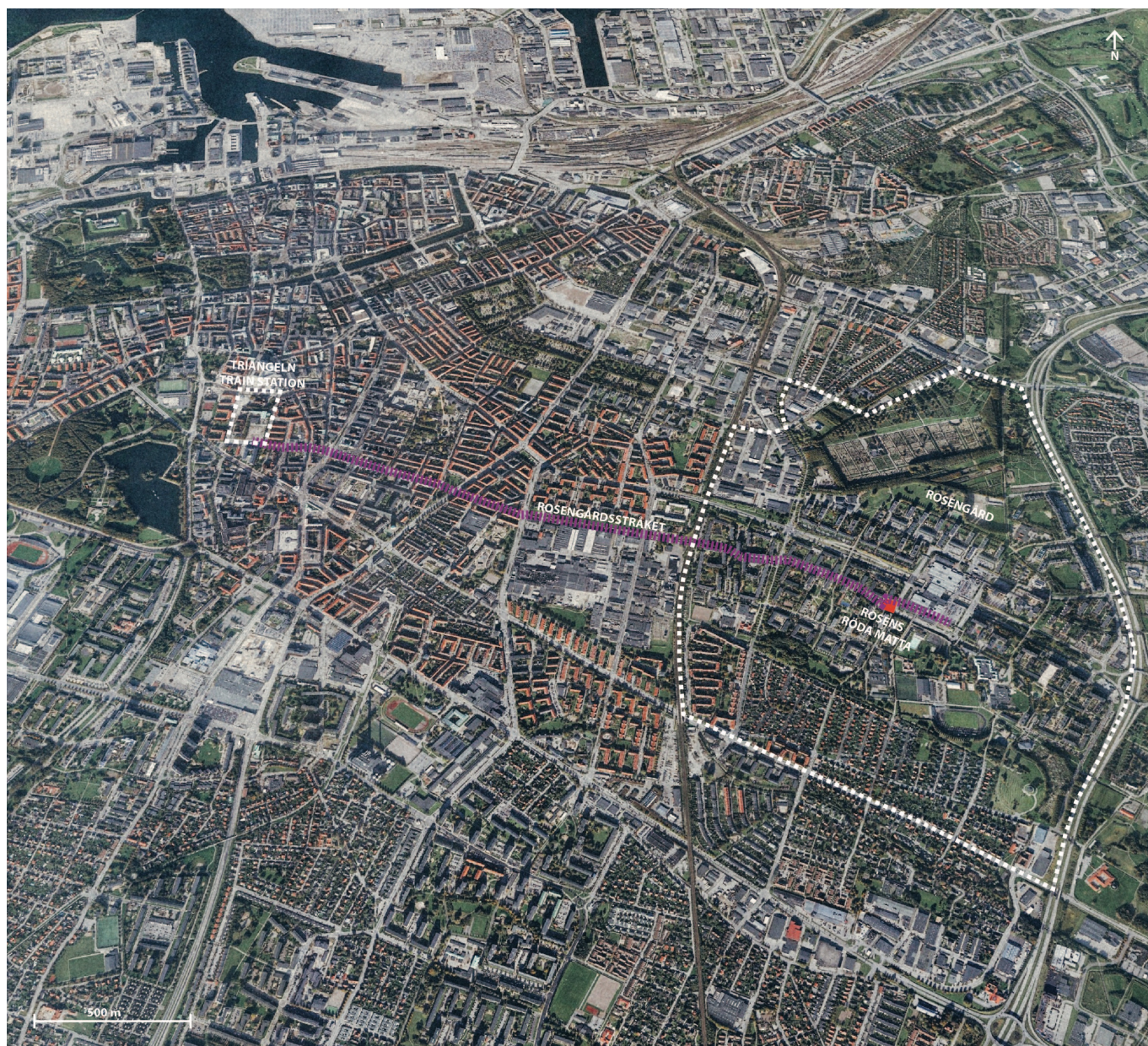
Karta över Malmö som visar hur Rosengårdsstråket löper och var Rosens röda matta ligger.

stagande i det offentliga rummet. Platsen och projektet fick senare namnet Rosens röda matta .