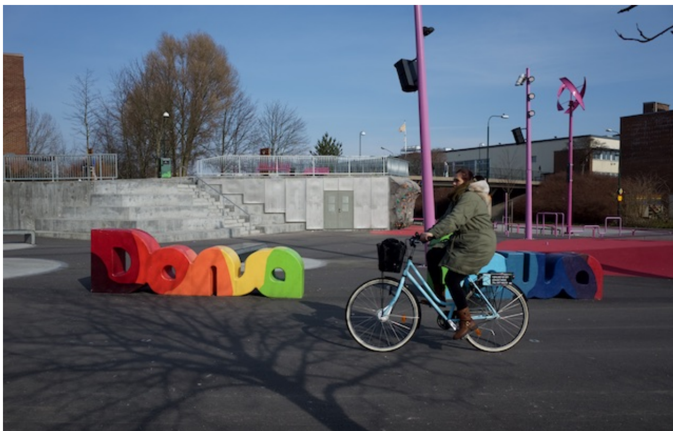
Bilder på Rosens röda matta.