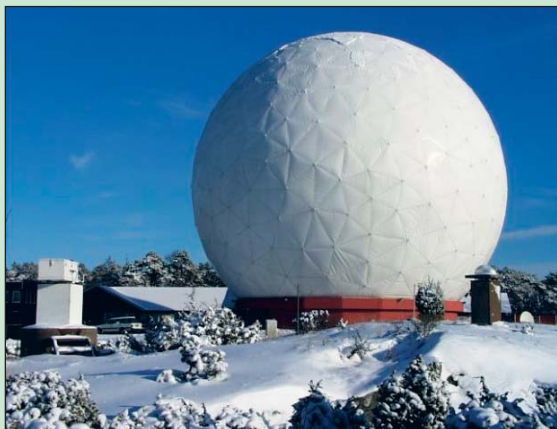
Bild 1: Onsala rymdobservatorium. I mitten på bilden syns det radominneslutna 20-metersteleskopet, vilket huvudsakligen används för radioastronomisk forskning, där frekvenser upp till strax över 100 GHz tas emot med en god verkningsgrad. Teleskopet används också för geodetisk VLBI, då det samtidigt tar emot signaler från de mest avlägsna galaxerna vid frekvenser omkring 2,3 och 8,4 GHz (S- och X-band). I förgrunden till vänster står en mikrovågsradiometer, vars uppgift är att mäta den termiska strålningen från vår atmosfär, och utgående från dessa data kan mängden vattenånga och flytande vatten (moln) beräknas i mättriaktionen. GPS-antennen syns just till höger om radomen (se också Bild 3).

De mätningar vi utför sker med elektromagnetiska vågor i form av radio, infraröda eller optiska vågor. Mätningarna kan göras antingen från marken eller från satelliter i rymden. Passiva mätningar innebär att elektromagnetisk strålning från avlägsna galaxer, stjärnor eller från vår egen jord tas emot. Aktiva mätningar sker genom utsändning av elektromagnetiska vågor, t.ex. via radar i flygplan eller via navigations signaler från GPS-satelliter, där vi studerar vad som